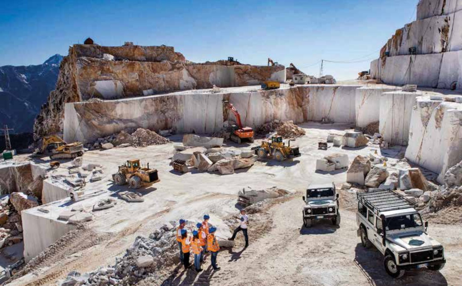
Wir betreten eine einzigartige Umgebung, die sonst nicht zugänglich ist – Bauhelme sorgen für unsere Sicherheit

Seit der Römerzeit liefern die weißen Marmorberge von Carrara das Material für weltberühmte Werke wie Michelangelos Statue „David“ und Bauwerke wie den Petersdom in Rom. Unterhalb der Steinbrüche steigen wir in geländegängige Autos, die uns durch einen Tunnel in das aktive Abbaugelände von Fantiscritti bringen. Dort teilen wir uns auf: Im Wechsel besucht eine Gruppe das Steinbruchmuseum, die andere startet zu einer etwa 40-minütigen 4x4-Tour im Geländewagen oder Minivan. Zwischen modernen Maschinen und gewaltigen Marmorblöcken erleben wir die Dimensionen, in denen das „weiße Gold“ gefördert wird.