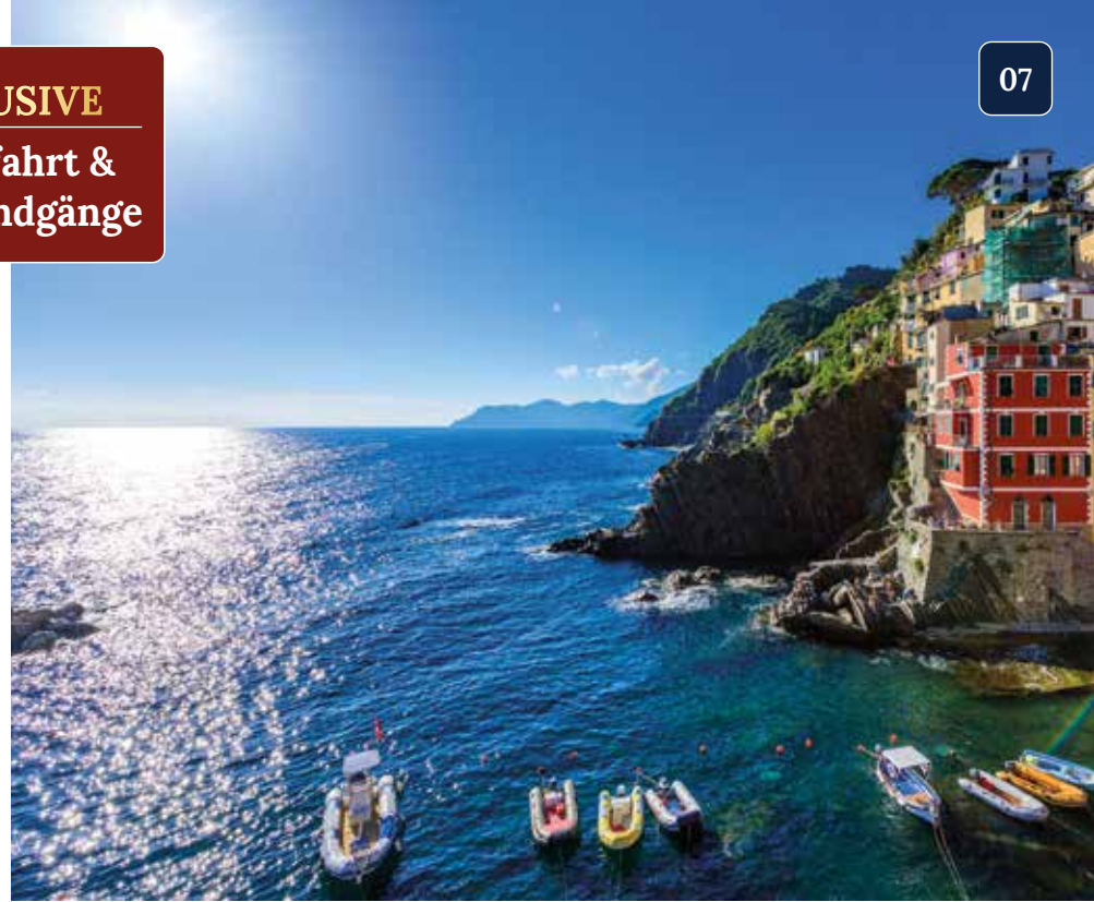
Schiffahrts-Panorama: bunte Dörfer und steile Felsenklippen