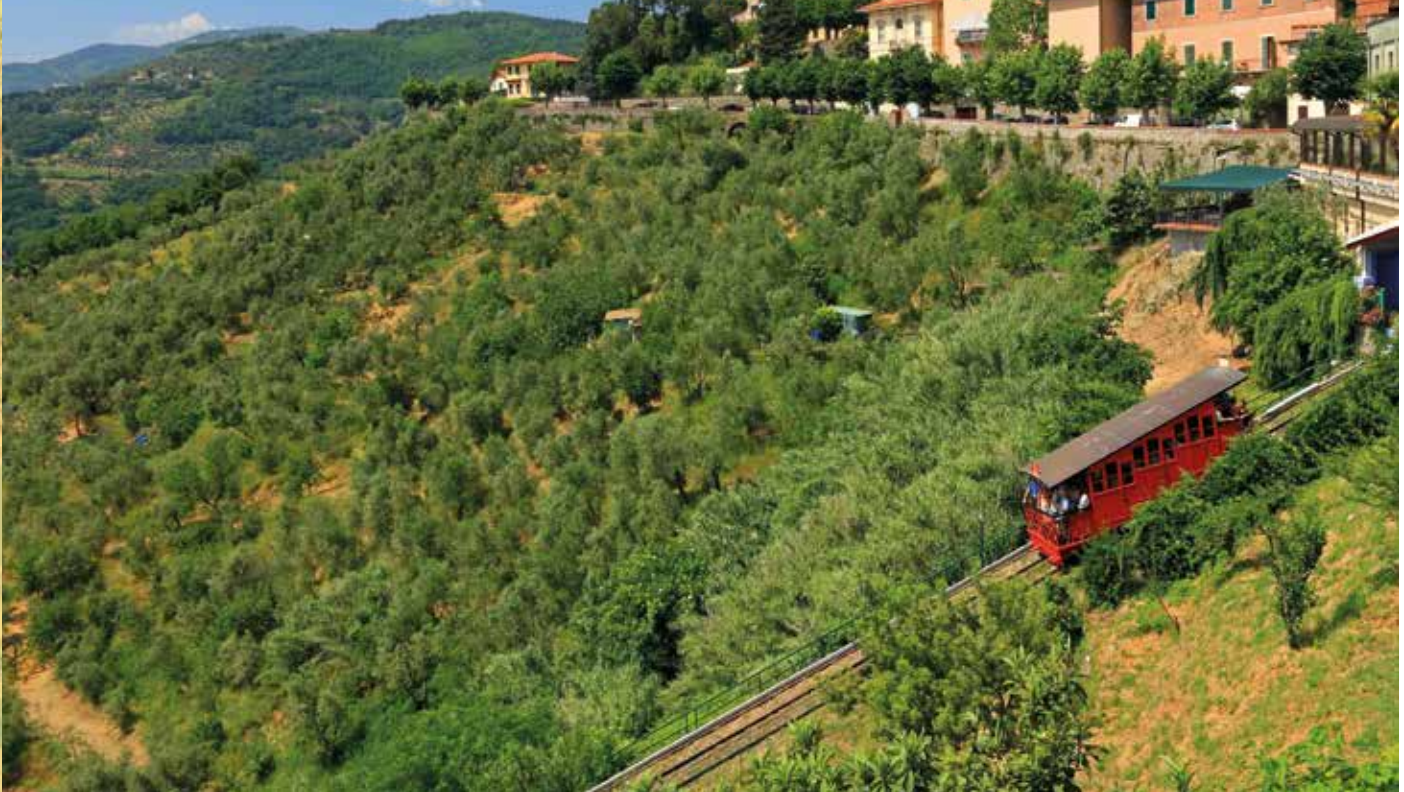
Freizeittipp: Fahrt mit der nostalgischen Standseilbahn zur oberhalb gelegenen Altstadt (gebührenpflichtig)