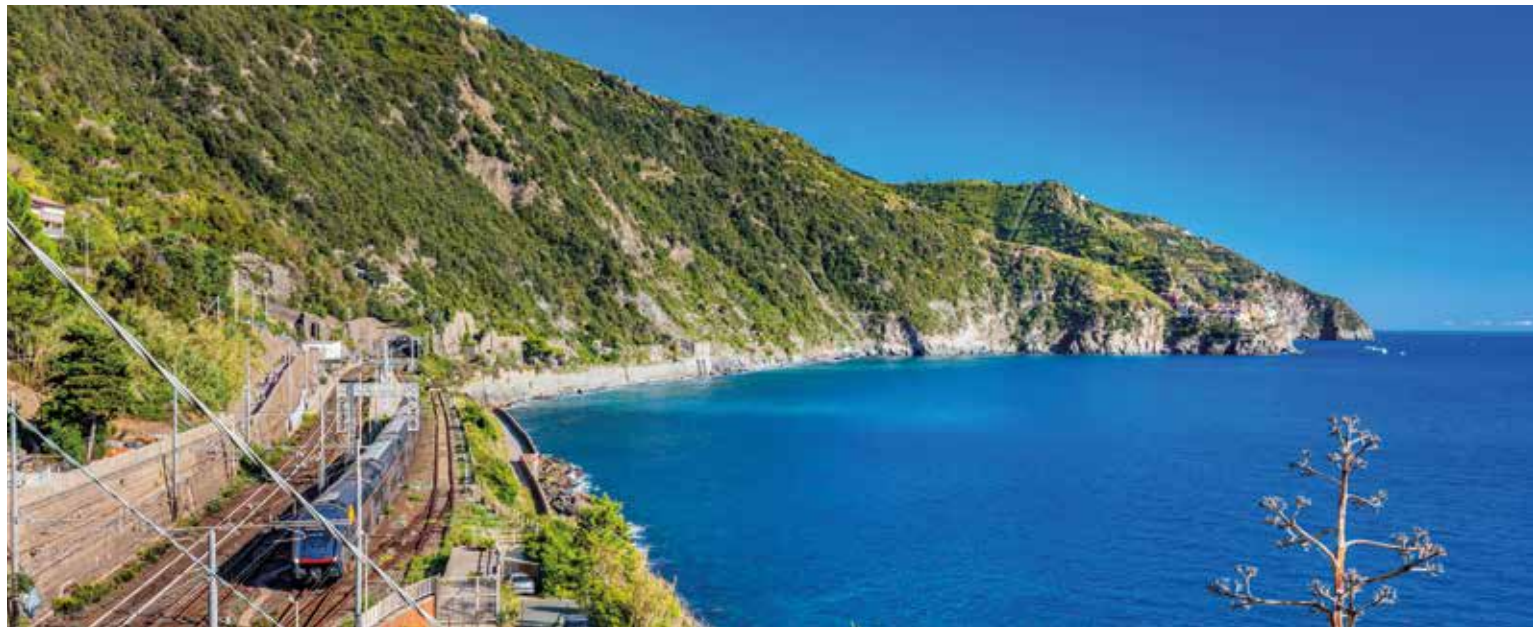
Zugfahrt entlang der ligurischen Steilküste – eine Strecke mit Meer, Felslandschaft und weitem Horizont