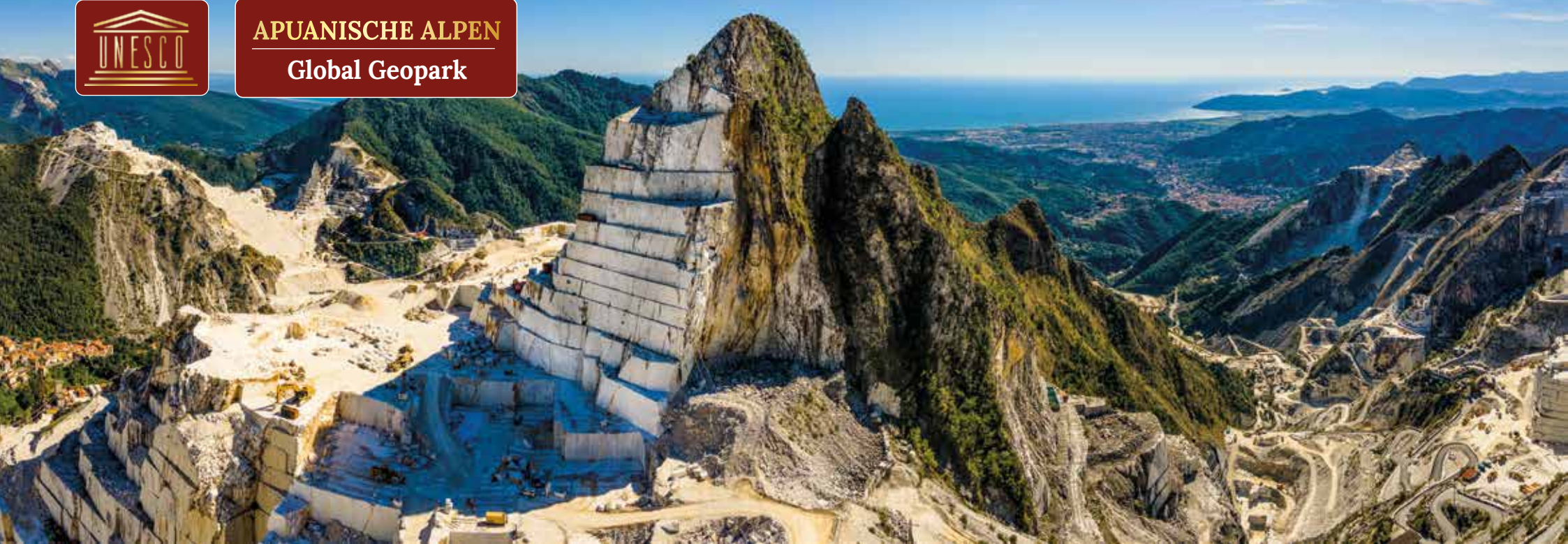
Die weißen Terrassen der Carrara-Steinbrüche gehören zu den spektakulärsten Landschaftsbildern Italiens