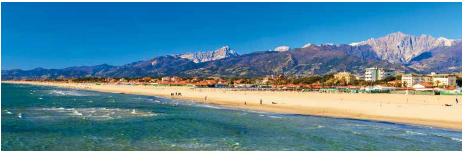
An einer Promenade der wunderschönen Versiliaküste verbringen wir etwas Freizeit

Die Spezialität Lardo di Colonnata ist ein luftgereifter Speck, der seit Jahrhunderten in Kübeln aus Carrara-Marmor reift. Ursprünglich war er eine kräftige Mahlzeit der Steinbrucharbeiter. Gewürzt mit Salz, Knoblauch und Kräutern, erhält er sein charakteristisches Aroma. In einem Restaurant nahe den Steinbrüchen genießen wir den traditionell zubereiteten Speck, der mit regionalem Käse, herzhaftem Gemüsekuchen und einem Glas Rotwein gereicht wird.