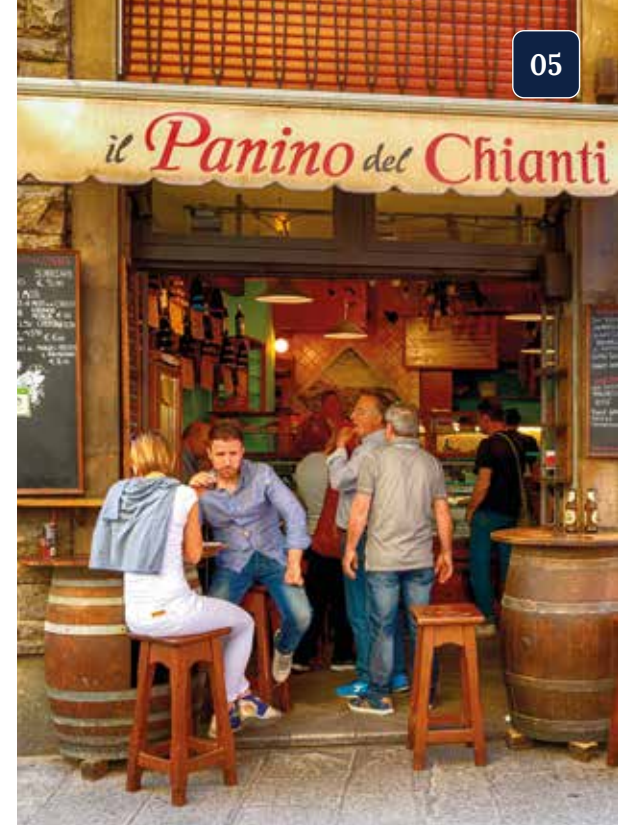
Typ: Auszeit in einer typischen Paninibar