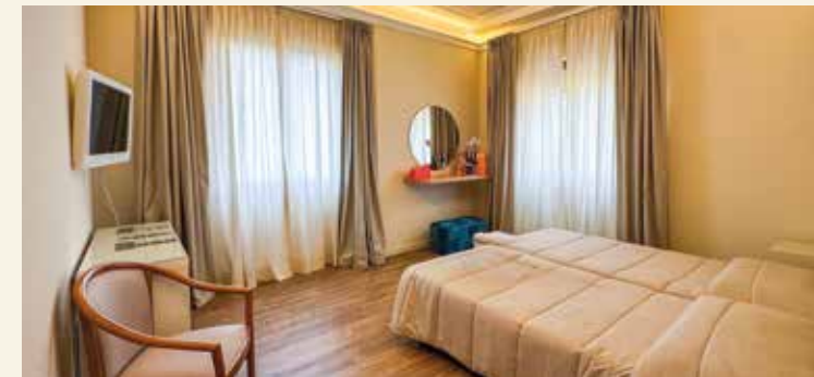
Unsere Doppelzimmer variieren im Design

HolidayCheck: „99% Empfehlung“, Stand: Mai 2026