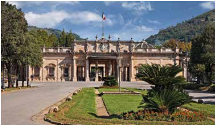
Beeindruckende Terme Tettuccio am Stadtpark